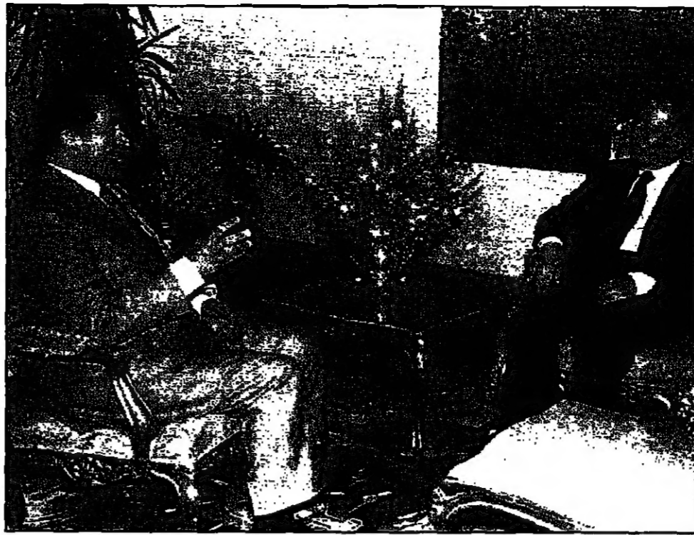
الرئيس السوري حسني مبارك يجري مباحثات مع نائب الرئيس السوري عبد الحليم خدام في القاهرة أمس

القاهرة - الوحدانية - عبد الحليم خدام، نائب الرئيس السوري عبد الحليم خدام، أمس الاثنين في القاهرة عقب اجتماعه مع الرئيس السوري بشار الأسد في مقره في دمشق. وكان في استقباله في المطار وزير الخارجية السوري نوري بشار الأسد. وكان في استقباله في المطار وزير الخارجية السوري نوري بشار الأسد. وكان في استقباله في المطار وزير الخارجية السوري نوري بشار الأسد.